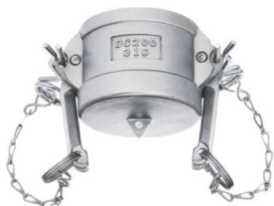
KAMLOK SNOW SKK DC Záslepka rychlospojkového trnu kód 30531