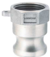
KAMLOK SNOW A SS Trn rychlospojky s vnitřním závitem kód 30532