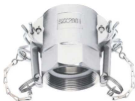
KAMLOK SNOW SKK I-G Rychlospojka s vnitřním závitem kód 30529