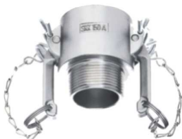
KAMLOK SNOW SKK A-R Rychlospojka vnějším závitem kód 30530