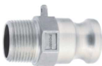
KAMLOK SNOW F SS Trn rychlospojky s vnějším závitem kód 30533