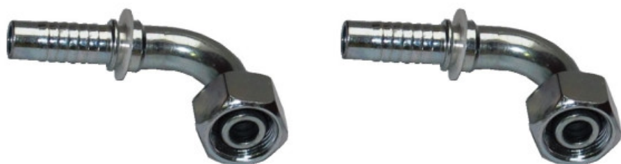
METRIC FEMALE 24° CONE - 90° ELBOW - L TYPE