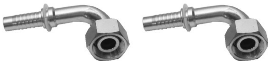
BSPP FEMALE 90° ELBOW (THRUST-WIRE NUT)