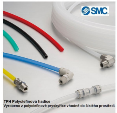
TPH Polyolefinová hadice Vyrobeno z polyolefinové pryskyřice vhodné do čistého prostředí.