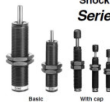
Basic With cap