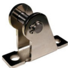
Pivot Bracket Standard: Double Acting Single Rod Series CM2