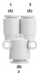
Different Diameter Union "Y": KQ2U