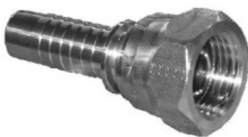
NPSM SWIVEL FEMALE 60° CONE - DKN -