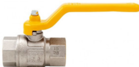
066 London ball valve, full flow