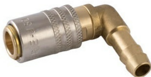
466 S ventilem